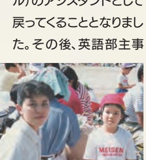
年長時の明泉デー