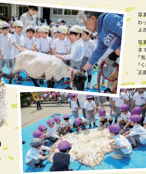
写真上:20分くらいで毛刈りが終わってすべすべに。羊さんも気持ちよさそうです。