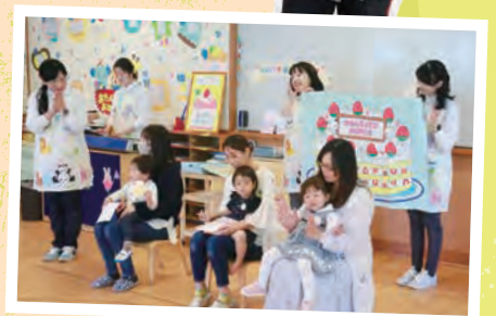
先生たちからお祝いの歌をプレゼント!