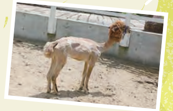
アルパカのモカちゃんも毛刈りしたよ!

羊の毛刈りが終わった後、子どもたちが小嶋さんにごんごん質問をしていましたよ! QRコードからご覧ください。